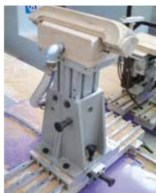
SFR – il banco più accessibile (regolabile anche in altezza) the most accessible table (also with height adjustment)