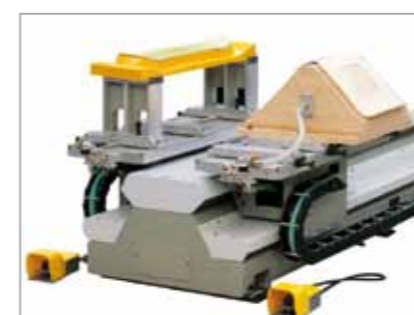
CSR – il banco più semplice da usare the easy to use table