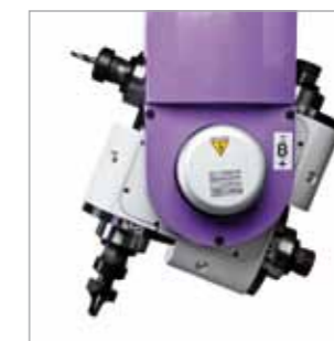
CS44 4 mandrini 9,2 kW ciascuno 4 electrospindles 9.2 kW each

The small, great Balestrini: compact, flexible, powerful and versatile.