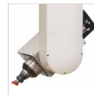
LI 11 C.U. 1 mandrino con cambio utensile - potenza da 9,2 a 15kW 1 electrospindle with automatic tool changer - power on request from 9,2 up to 15 kW