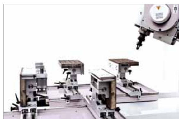
COMBI© - il banco modulare per tutte le applicazioni the modular table for all kind of application