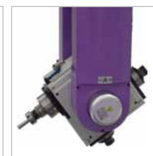
CS 33 C.U. 2 mandrini 9,2 kW + 1 mandrino 9,2 kW cambio utensile 2 electrospindles 9,2 kW + 1 electrospindle 9,2 kW tool changer