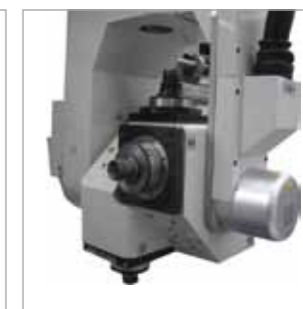
CCR 44 C.U. 3 mandrini 9,2 kW + 1 mandrino 9,2 kW cambio utensile 3 electrospindles 9,2 kW + 1 electrospindle 9,2 kW tool changer